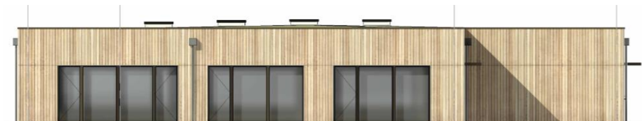
Billede 1: Beboerhus, facade mod nord

Beboerhuset bliver opført med en facade i træ med store vinduespartier og et tag med grøn bevoksning, som forhåbentlig bidrager til en fin udsigt fra de omkringliggende boliger og til at øge biodiversiteten i området.