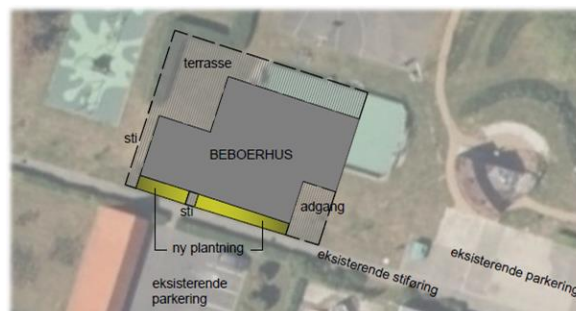
Billede 3 Placering af beboerhuset på fællesarealet

Forud for byggeriet har vi været nødsaget til at fjerne boldbanen, da den lå i vejen for det nye beboerhus. Der arbejdes på, at boldbanen reetableres snarest muligt på et areal i nærheden af fitnessredskaberne.