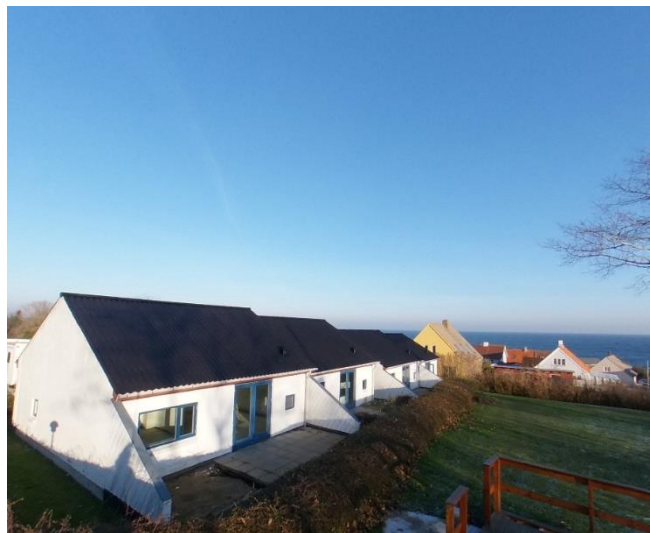
De udvendige arbejder mangler stadig i Norre Bakke