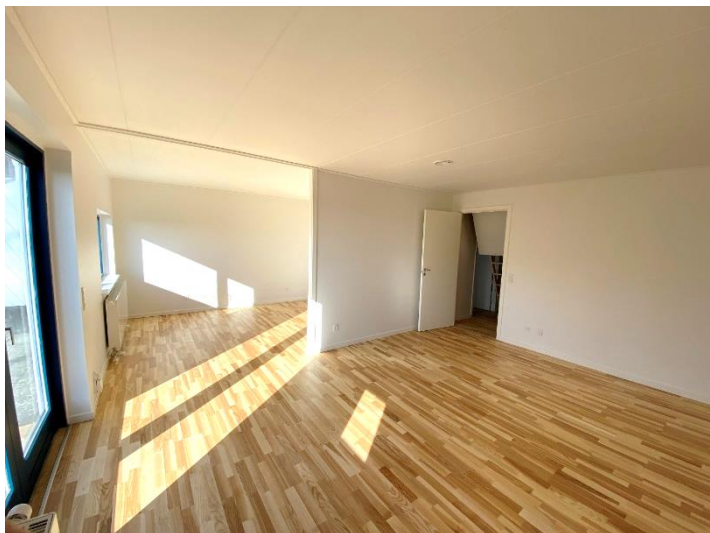
Færdigrenoveret bolig i Norre Bakke