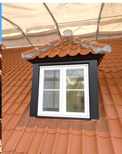
Kvistene på Postgade før og efter renoveringen